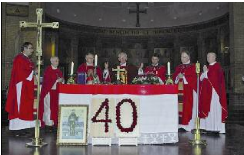
Svečano misno slavlje u roterdamskoj katedrali predvodio je mons. Pero Sudar

To je dobitak za ovu zemlju i za one koji u nju dolaze. U isto vrijeme, nama Hrvatima iz Hrvatske i Bosne i Hercegovine važno je da budemo integrirani, ali ne i iskorijenjeni. Stoga i Katolička Crkva preko ove misije daje tome svoj doprinos i poticaj za širenje vidika što je inspiracija da se raste, tj. da budemo više ljudi“, rekao