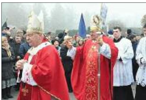
Misu u Vukovaru predvodio je kardinal Vinko Puljić

logaje kazao: „Ubijajući 86 nevinih života toga ponosnog hrvatskog mjestu, okupator je mislio stravičnim zločinima nad nedužnim civilima i razaranjima hrvatskih ognjišta i svetišta zauvijek ugasiť njihovu neutaživu čežnju za slobodom.“ Slavljene su mise diljem domovine za žrtve Domovinskog rata, tako i za nevino pobijene u Saborskom u kojem nije ostala nijedna hrvatska kuća, u mjestu u kojem