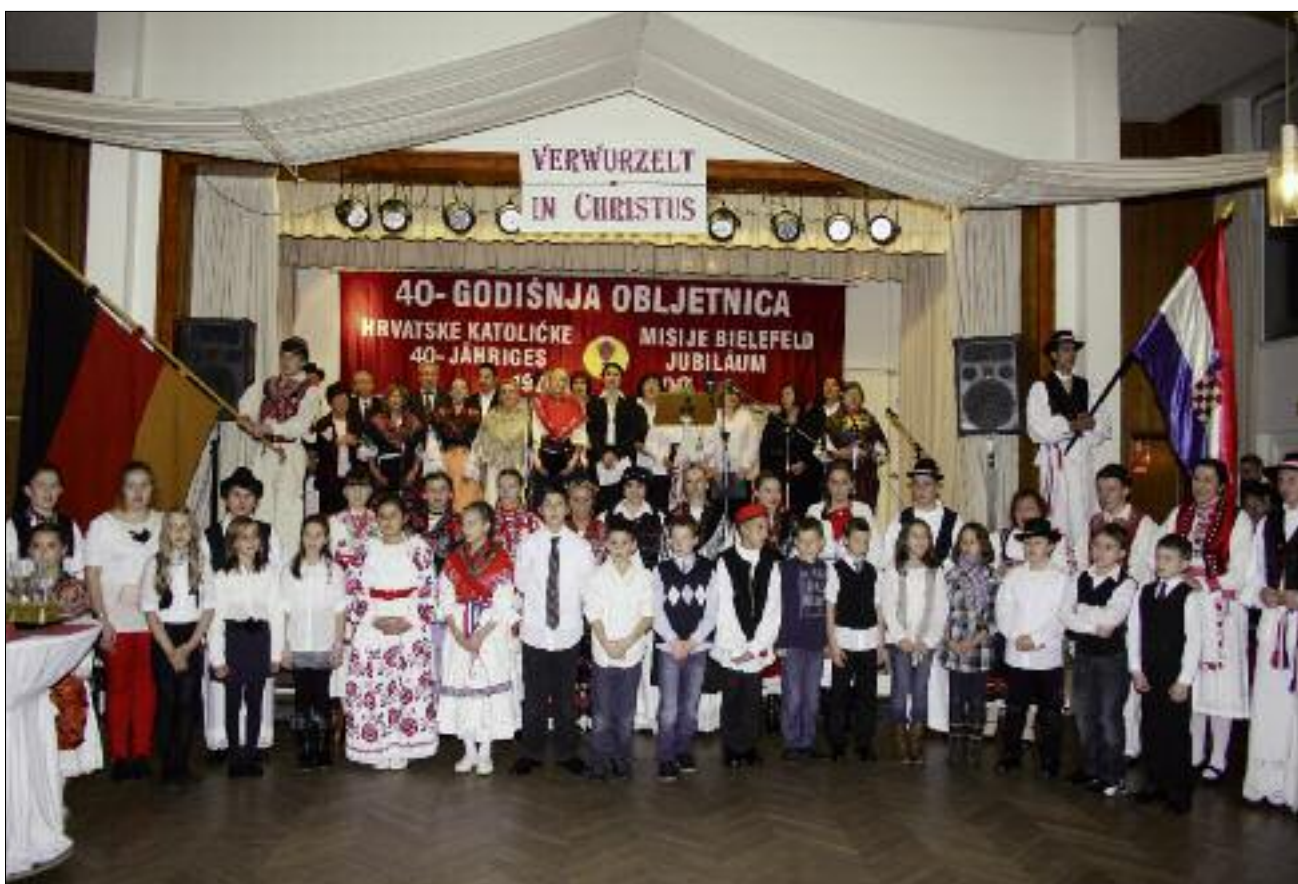
Posebno je bilo svečano u dvorani Caritasove kuće „Winfriedhaus“ u Bielefeldu

omogućila slaviti Boga na svom hrvatskom jeziku i njegovanje vlastite kulture i razvijanje svoje vjerske tradicije. S druge strane im je omogućila pronaći dio svoje domovine u mjesnoj Crkvi i njemačkoj kulturi. Zajednice drugih materinskih jezika dio su opće Crkve u kojoj nema stranaca. U našoj Crkvi su svi subraća, kazao je mons. Berenbrinker podsjetivši i na pozitivne osobne susrete s hrvatskim svećenicima i vjernicima u nadbiskupiji.