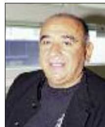
Vlč. Vinko Puljić

Vlč. Vinko Puljić postao je novi voditelj misije umjesto dosadašnjeg voditelja vlč. Jakova Grgića koji se vratio u domovinu.