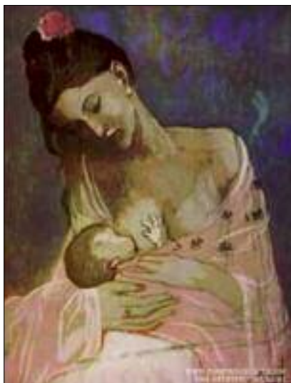
Pablo Picasso (1881.–1973.), „Majka i dijete“

naziv „Majka i dijete“. Umjetnik je dakako prikazao žene i djecu iz svoga obiteljskoga okruženja, što za nas kao promatrače i ljubitelje umjetnosti nije toliko važno. Ti prizori izriču mnogo više od svakodnevnog prikaza majke i djeteta. Na njima kršćanin može očitati božićnu poruku: „I Riječ je tijelom postala, i nastanila se među nama...“ (Iv 1,14). Iako na tim slika-