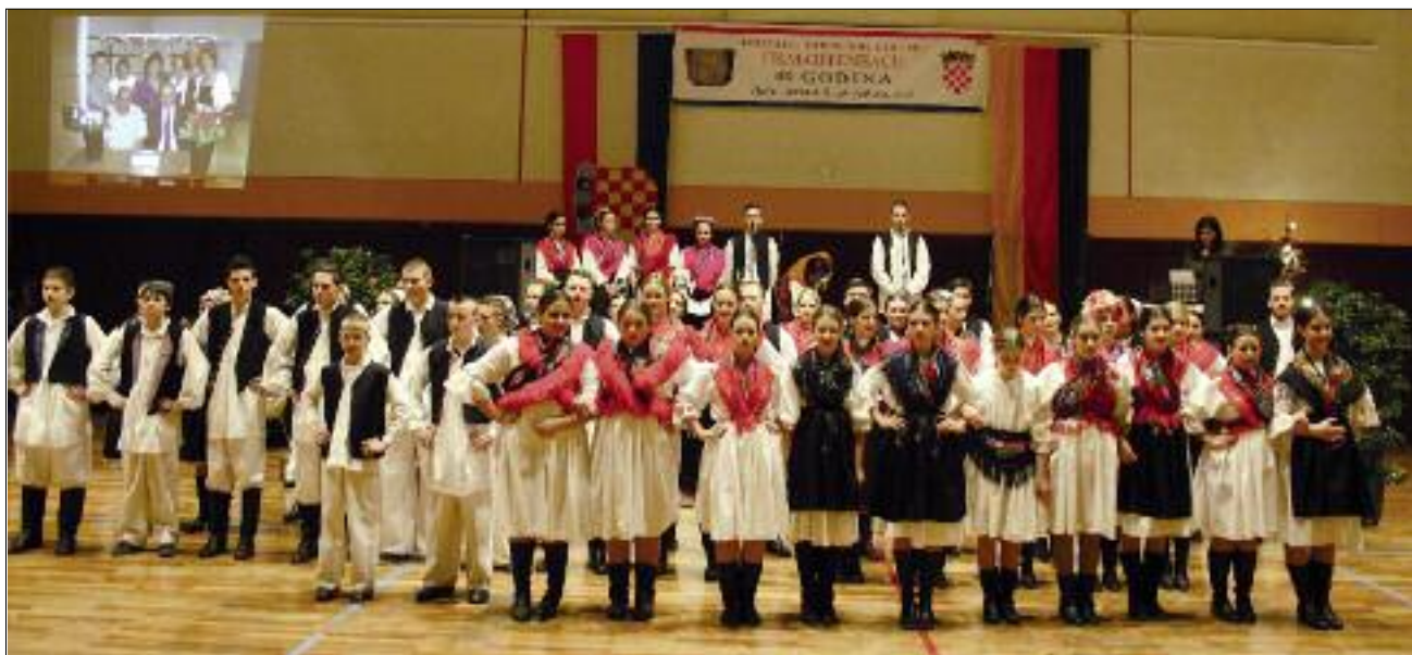
Vjernici svih generacija okupili su se na svečanoj proslavi misije u dvorani „Martinsee“ u Heusenstamm

svome području. Posebno je vidljivo svjedočanstvo vaše vjerničke životnosti i zauzetosti. U vašim misijama posebno dolazi do izražaja rad s djecom i mladima te ozračje obiteljske tradicije, o čemu svjedoči i ova večer. Vi ste stvarno bogatstvo za našu bis-