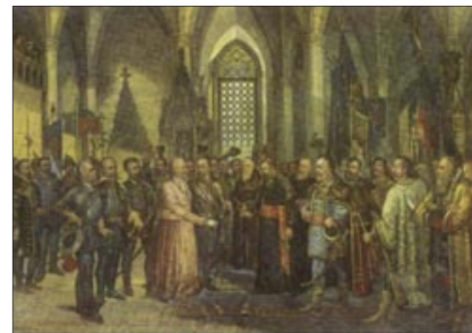
D. Weingartner, Sabor u Cetinu

Kralj Zvonimir stolovao je u Kninu, a kako za njegova vladanja nije bilo većih ratovanja, ojačao je raz-