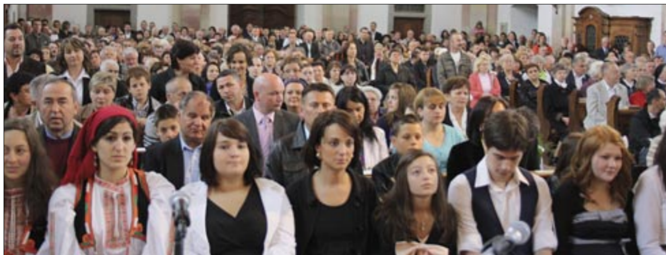
Okupljeno mnoštvo vjernika u svetištu u Birnaui