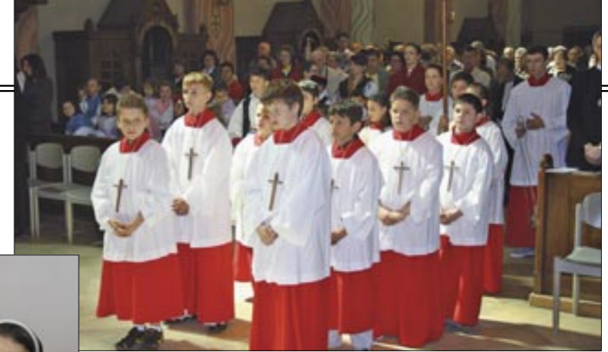
Ministrantska skupina broji oko trideset ministranata

Vjernici odlaze na hodočašća u Altötting, Birnau, Rim, Lurd, Padovu i sl., a i u domovinu. Tu su i svibanjske i listopadske pobožnosti. Održavaju