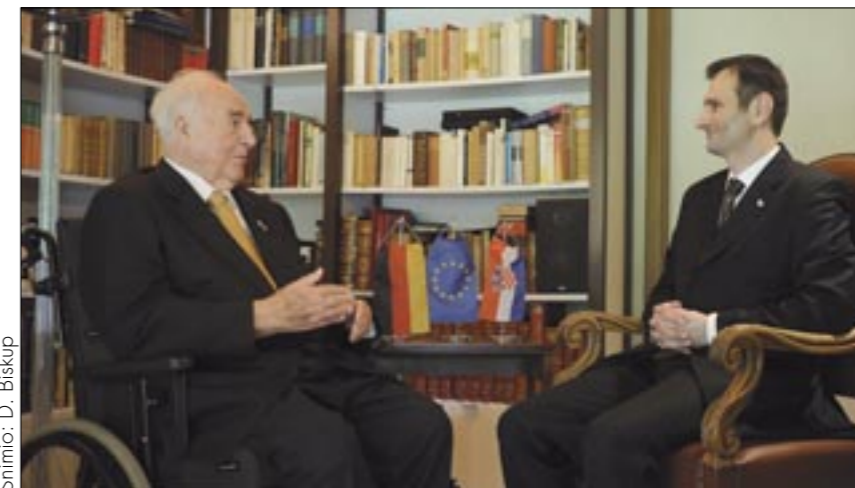
Dr. Kohl je sa zahvalnošću primio hrvatsko odlikovanje