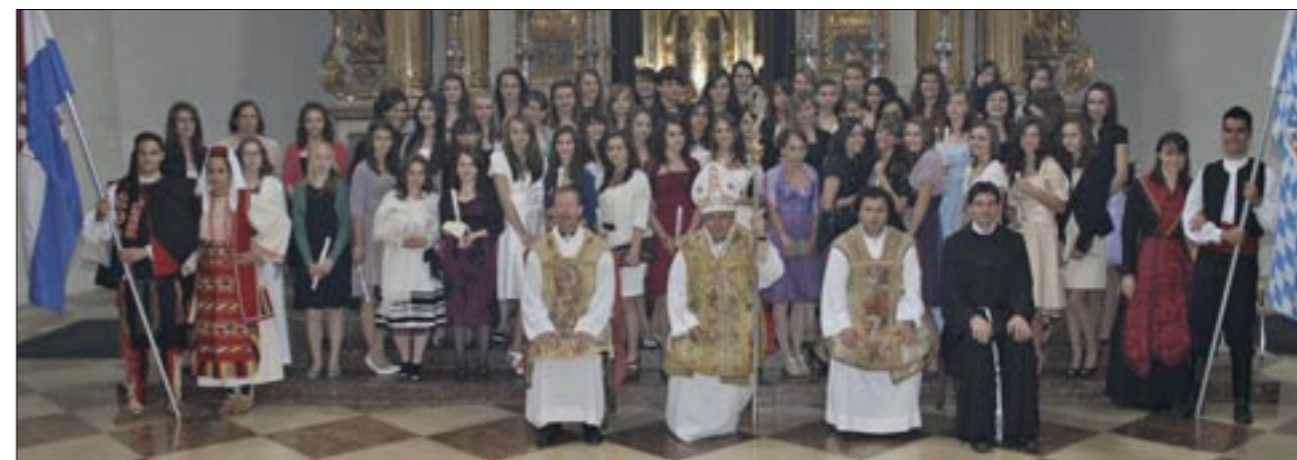
Krizmanici s kardinalom Vinkom Puljićem, o. Tomislavom Dukićem, mons. Wolfgangom Huberom i fra Borisom Čarićem

Nadbiskup vrhbosanski kardinal Vinko Puljić, u nedjelju 20. lipnja, u Hrvatskoj katoličkoj misiji München podijelio je sakrament potvrde koji je primilo 117 krizmanika iz Münchena i okolice. Slavlje je započelo ophodom u kojem su uz kardinala i sveće-