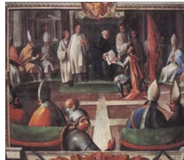
„Krunidba kralja“ Zvonimira, nepoznatog autora iz 1611., papinska palača, Tajni vatikanski arhiv, Pavlova dvorana, Vatikan

Kralj Dmitar Zvonimir dobro je procijenio tadašnju vanjskopolitičku situaciju: položaj Bizanta čija je moć slabila i Mlečana koji su se pridružili protivnicima sve jačeg papinstva. Tako je Zvonimir stao uz papu Grgura VII. (1073.–1085.), prihvaćajući suvremenu doktrinu da papa ima pravo dijeliti krunu i priznavati posjed zemalja.