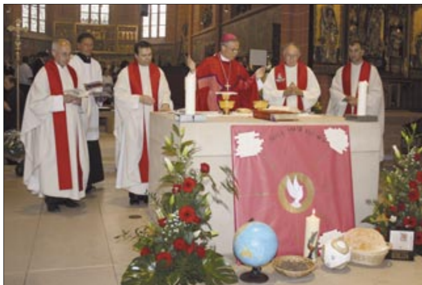
Misno slavlje predvodio je limburški biskup mons. Tebartz-van Elst

Limburški biskup mons. Franz-Peter Tebartz-van Elst je podijelio sakrament sv. potvrde, koji je primilo 109 krizmanika.