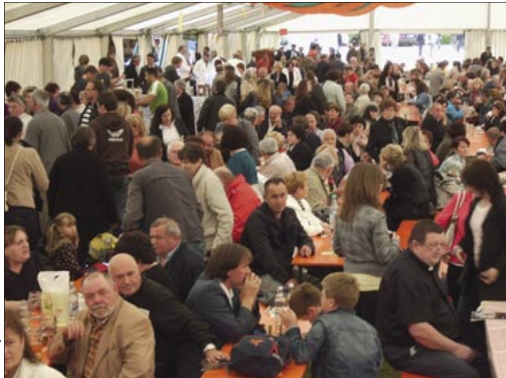
Kao i svake godine vjernici se nakon mise okupe u obližnjem šatoru