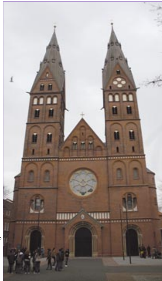
Schnitt: A. Polegubic

Beherrschendes Thema in der Diözese Hildesheim ist seit dem Amtsantritt von Bischof Norbert Trelle 2006 die Überprüfung aller 438 Kirchen nach den Kriterien Bevölkerungs- und Katholikenzahl und baulicher Zustand. Angesichts einer starken Zuwanderung in den 1950er Jahren wurden im flächenmäßig