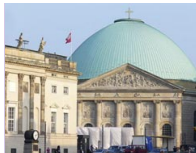
St. Hedwigs-Kathedrale in Berlin

Besonders stark war der Umbruch in der seit 1989 von Kardinal Georg Sterzinsky geleiteten heutigen Hauptstadt-Erzdiözese Berlin. Statt 210 Gemeinden – wie noch vor sechs Jahren – gibt es jetzt noch 108. Gut 440 Vollzeitstellen, vor allem mit Pfarrsekretärinnen, Küstern, Organisten und