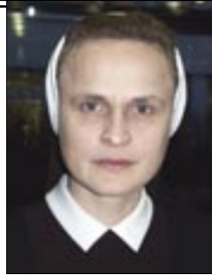
Piše: s. Nela Gašpar