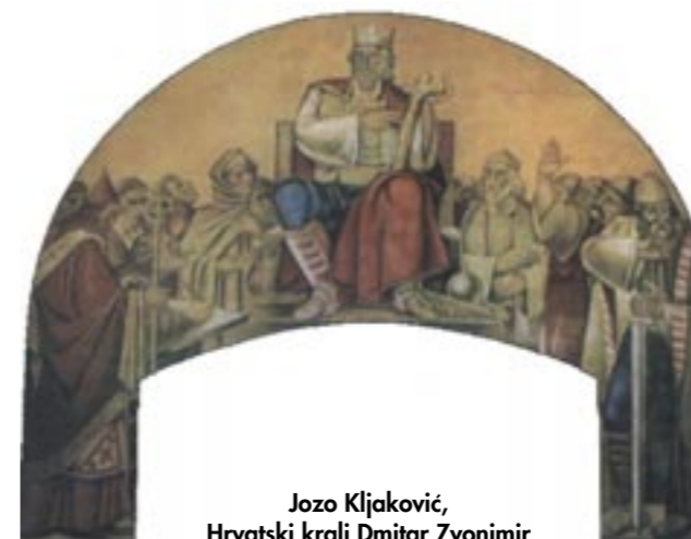
Jozo Kljaković, Hrvatski kralj Dmitar Zvonimir

vitak gospodarstva i kulture. Zvonimir koji je bogato darivao crkve i samostane, dao je izgraditi trobrdnu baziliku u Biskupiji kraj Knina, a od svih njegovih darova najpoznatiji je dar samostanu sv. Lucije u Baškoj na otoku Krku. Naime redovnici su oko god. 1100. dali uklesati glagoljicom opis darivanja na Baščansku ploču, na kojoj se spominje ime kralja Zvonimira.