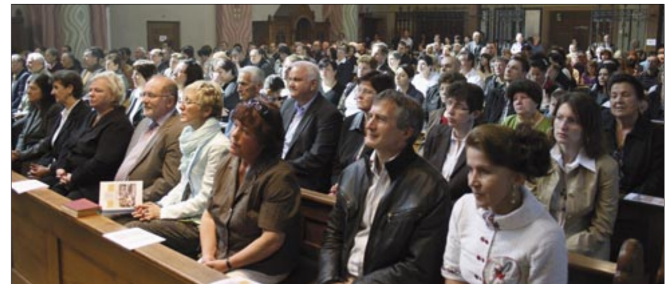
Vjernici za vrijeme mise u crkvi sv. Sebastijana